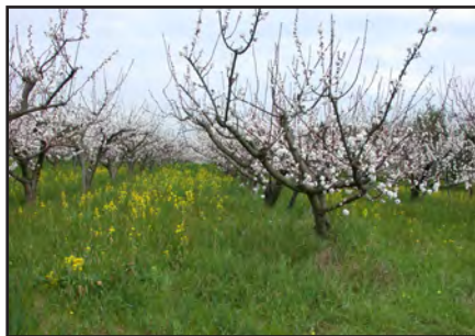
Inerbimento per rovescio in azienda biologica

Buoni risultati potrebbero essere ottenuti dall'impiego di specie annuali autoriseminanti tipo il Trifolium subterraneum , la cui tolleranza nei confronti dell'ombra lo rende utilizzabile anche in oliveti intensivi in piena produzione. Questa erbacea, dall'apparato radicale superficiale, prima del periodo siccitoso si autorisemina e muore per ricostituire il cotico con le prime piogge autunnali. L'inerbimento temporaneo può essere realizzato anche assecondando lo sviluppo di certe piante erbacee spontanee nel frutteto, rilasciando, al momento dello sfalcio, alcune "isole" di vegetazione per la produzione di seme ed il conseguente rinnovamento delle specie. Il destino dei residui vegetali dell'inerbimento è duplice: essi possono essere interrati (sovescio) o lasciati in superficie (pacciamatura). Nel primo caso i processi di decomposizione sono più rapidi (tabella