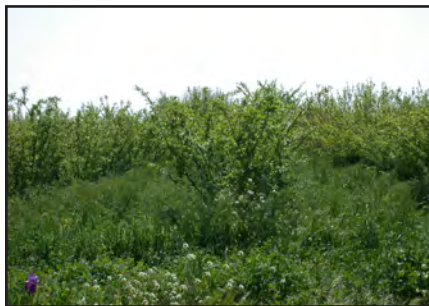
Inerbimento in giovane impianto di susino